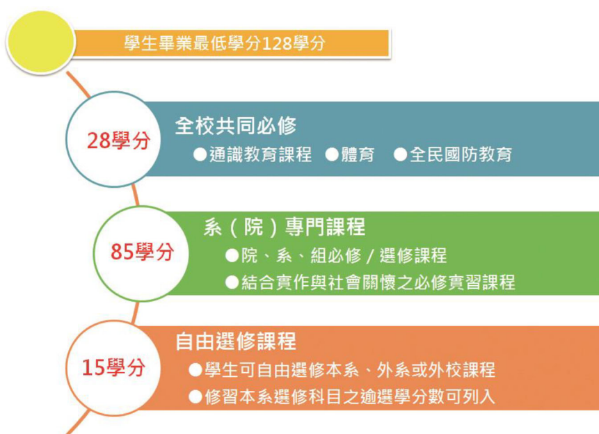
本校現行學分架構圖